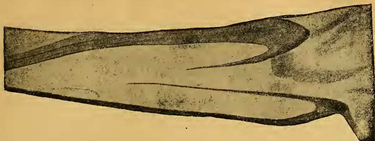
Abb. 5. Teil des Flügelgeäders von Calyptulus irritans .

Streifen von der Basis bis zur Mitte, kurzes Streifchen postmedian und apical, auf 4—7 dieselben postmedianen Streifchen, die sich